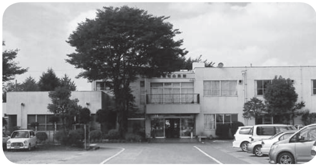
多くの方が利用する邑楽町公民館

生涯学習課長 開館以来36 年経過し、雨漏り・強風時 の雨水の浸入等あり、その 都度補修を行っている。利 便性についても舞台が狭 く、音響設備が悪く不便を 来している。公民館の建築 等に活用できる補助金につ いて調査中である。