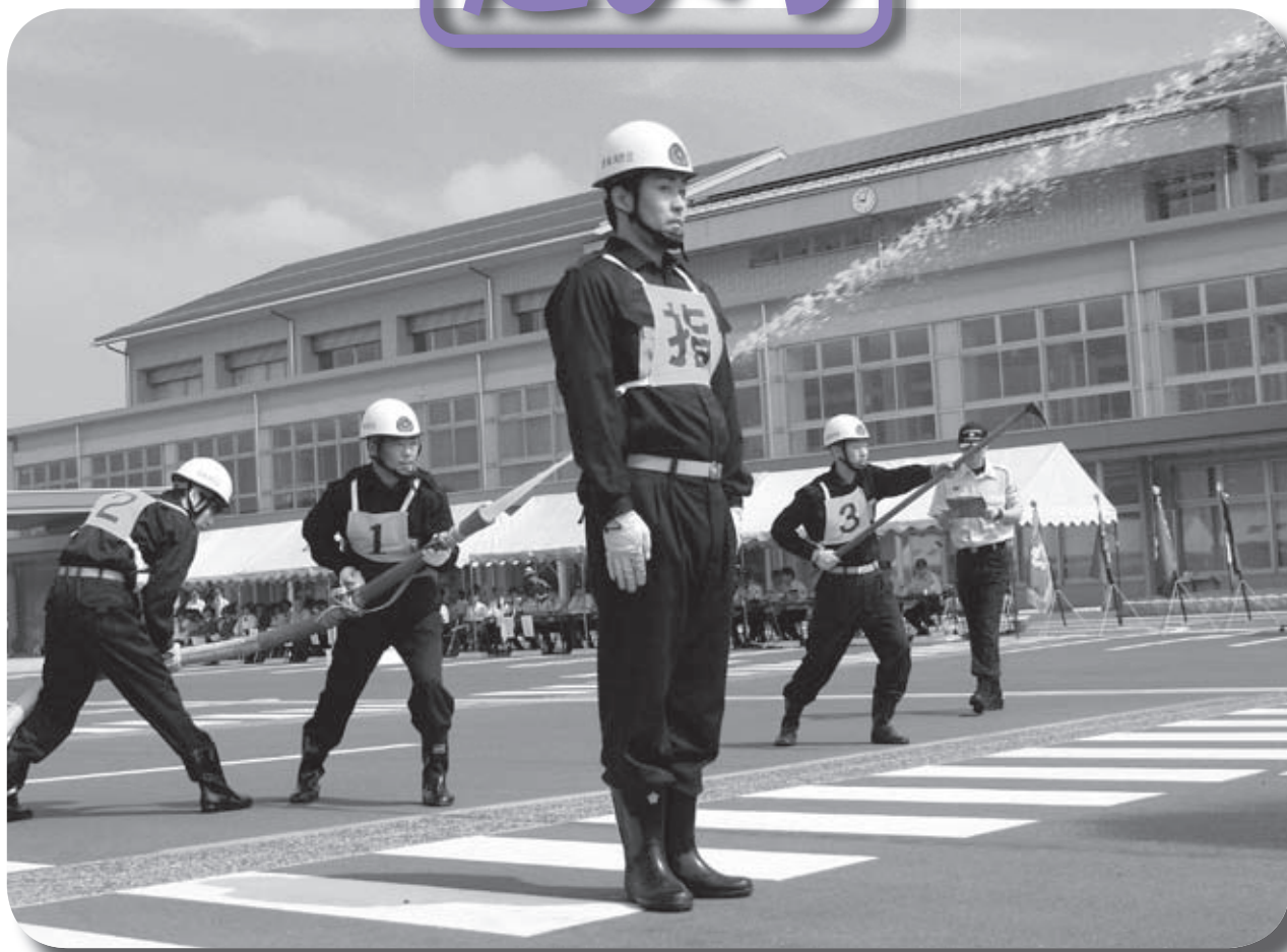
消防団ポンプ操法競技大会