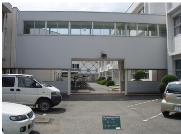
①施工前 渡り廊下東側外部