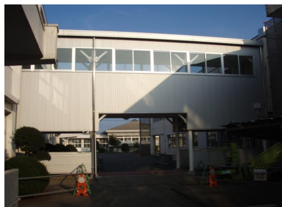
②施工後 渡り廊下西側外部