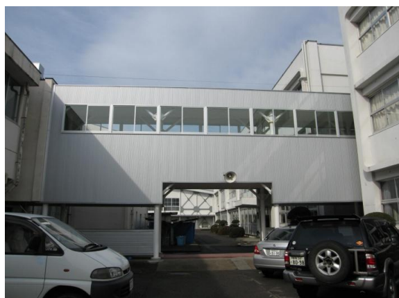
①施工後 渡り廊下東側外部