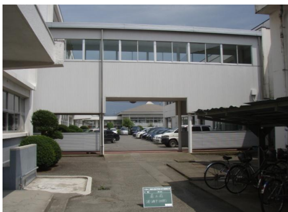
②施工前 渡り廊下西側外部