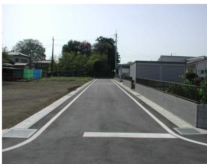
区画道路 6-6 号線(裏面②)