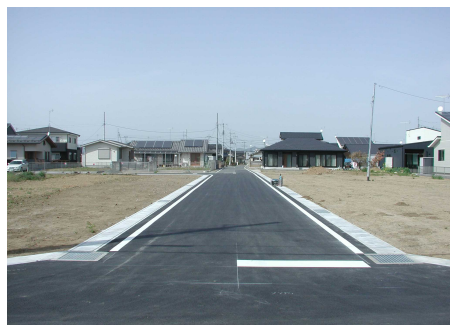
区画道路 6-24・25 号線(裏面④)

工事延長 区 6-24 号線 39 m 区 6-25 号線 67 m ※車道築造 舗装面積 区 6-24 号線 219 m 2