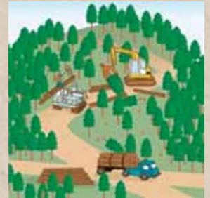
適切に森林整備を推進！

ことから、森林の土地の所有者の把握を進めるため、平成24年4月から森林法に基づく森林の土地の所有者となった旨の届出制度が創設されました。なお、この届出により、森林の土地の所有権の帰属が確定されるものではありません。