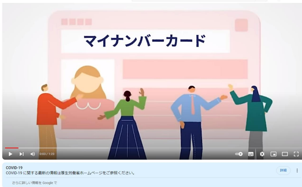
マイナンバーカード「いま」と「これから」

マイナンバー 制度「報告」と「対策」 (youtube.com) https://www.youtube.com/watch?v=cPGselfiWxc