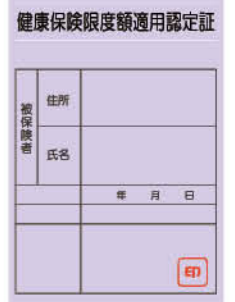
認定証がなくても免除