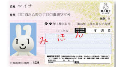
健康保険証として利用すれば……

過去に処方された薬や特定健診などの情報が医師・薬剤師に共有され(※)、データに基づく最適な医療が受けられるようになります。 ※マイナンバーカードを健康保険証として利用し、医師などと過去の情報を共有した場合には、健康保険証で受診した場合と比べて、初診時などの医療機関・薬局での窓口負担が軽くなります。