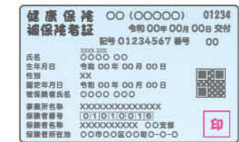
保険証の切り替え・更新が不要

今後、転職や転居などで必要だった保険証の切り替えや更新が不要になります。なお、新しい保険者への加入手続きは今後も必要です。