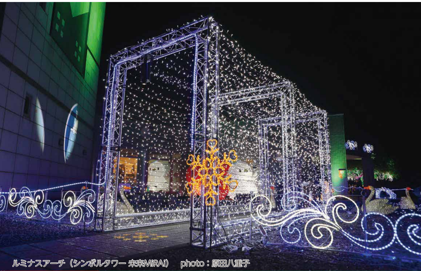
ルミナスアーチ (シンボルタワー 未来MIRAI)