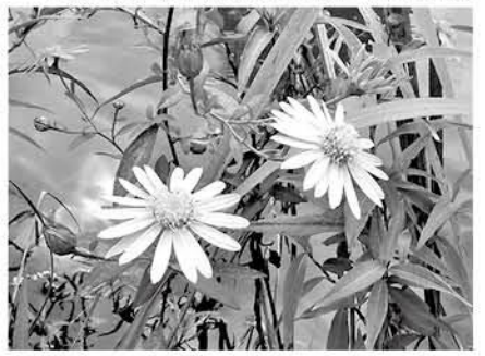
カントウヨメナの花

秋になると、田んぼの縁や水辺には野菊が一斉に花を咲かせます。私たちが普通に野菊と呼んでいるもののなかには、ヨメナ・カントウヨメナ・ユウガギク・ノコンギクなどがあるようです。邑楽町で普通に見られるのはカントウヨメナとユウガギクで、この2つはよく似ています。カントウヨメナは水湿地を好むため、水田の畔道では普通の植物でしたが、耕作環境の変化により非常に少なくなってしまいました。それでも文化財保護区の中野沼の周辺にはまだ普通に見られます。ヨシ刈りなどが行われなくなり、管理放棄で大型の植物が生育旺盛となると直ぐに衰退してしまいます。カントウヨメナは日本固有種で関東から東北地方の一部に分布しています。薄紫色をした頭花は2.5cmくらいで、ユウガギクとは一回り小さい感じですよ。一方、ヨメナは中部地方から九州に分布し、自生地を東日本、西日本で分けています。万葉植物事典(1995年)によりますと、ヨメナは「うはぎ」という古名で呼ばれ、春の野に若菜を摘む様子が詠まれています。万葉の時代から人々とともに生きてきた野生植物なのです。文化財の一部として守っていききたいものです。