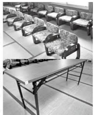
立ち座りしやすい椅子と机

第30区自治会 第30区自治会集会所にテント、机、椅子などが設置されました。これは、宝くじの収益金などを財源に、(一財)自治総合センターが実施している「一般コミュニティ助成事業」を活用したものです。