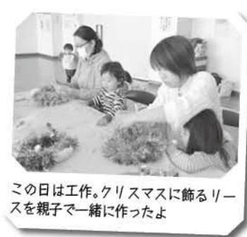
この日は工作。クリスマスに飾るリースを親子で一緒に作ったよ

同じ学校区の同月齢の子ども同士が集い、ふれあう場所。子ども同士の交流がママにとっての交流にもなります。肩の力を抜いて参加してみてください。楽しいですよ☆