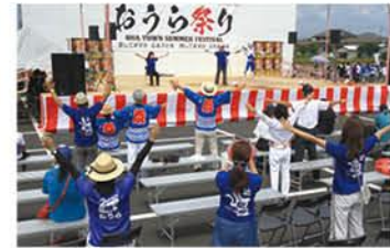
さわやか邑楽健康体操 in おうら祭り