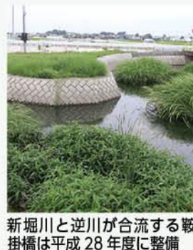
新堀川と逆川が合流する坂掛橋は平成28年度に整備

また、大雨で冠水被害が発生したことがある多々良川、新堀川、逆川では河川管理者の群馬県と改善の整備を進めているところです。