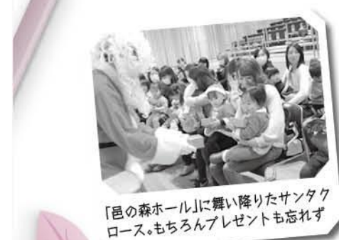
「邑の森ホール」に舞い降りたサンタクロース。もちろんプレゼントも忘れず