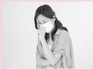
保護者の病気や冠婚葬祭などのときに、子どもを預ける