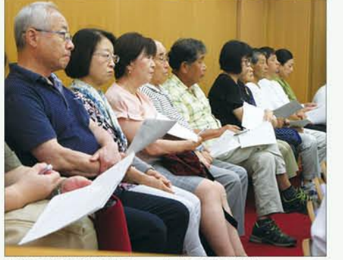
議場の傍聴席は満員に。大人たちも真剣