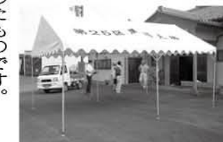
テントには行政区名を入れて

第25区自治会 第25区自治会集会所にテント、エアコンなどが設置されました。これは、宝くじの収益金などを財源に、(公財)県市町村振興協会が実施している「魅力あるコミュニティ助成事業」を活用したものです。