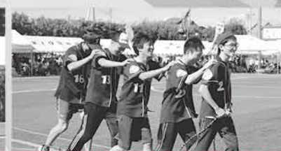
スポーツクラブ対抗百足競争

職場の仲間やサークルの友達と一緒に参加しませんか。奮ってご参加ください！ ▶申込・問合せ先 町民体育館