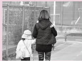
保育施設や小学校、塾などへの子どもの送迎