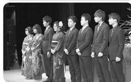
式典の壇上で整列する実行委員(昨年の様子)