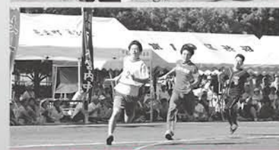
団体・事業所対抗リレー