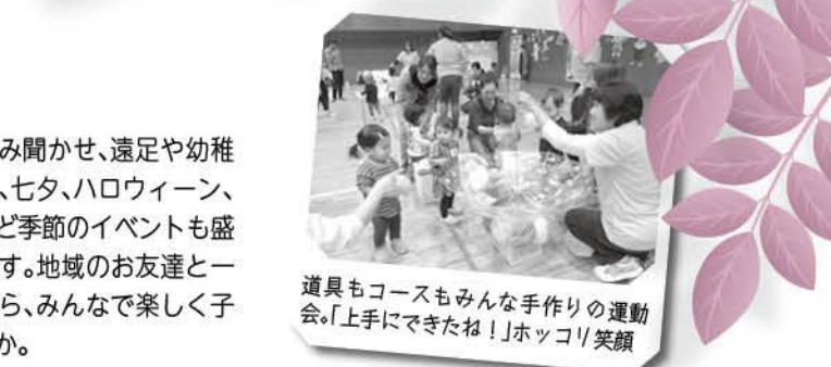
道具もコースもみんな手作りの運動会。「上手にできたね！」ホッコリ笑顔

「子育ての悩みを相談したい」「ママ友がほしい」「同年代のいろんな子たちと交流させたい」そんなときは子育てひろばへ来てください。子育てひろばは、本年度中に2歳になるお子さんとその保護者を対象に、中央公民館、長柄公民館、ヤングプラザで開催しています。