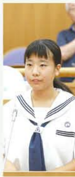
8 邑楽南中学校(谷中22区) 宮永花音 議員

町立図書館では、季節に応じた特集をカウンター前のコーナーに設けています。ここでは職員が考えたテーマに関係のある絵本や雑誌、本などを紹介して、「とにかく手にとってもらう」という意気込みで取り組んでいます。