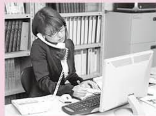
保育施設などの保育開始前や保育終了後に、子どもを預ける