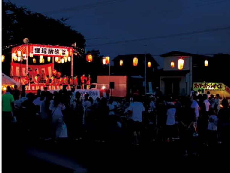
時代とともに、祭り自体が消滅している地域がある中、形を変えて続く狸塚の祭り。昔も今も地域の人たちのにぎわいは変わりません

夏になると田の草取りをした。体力がついてきたころなので、腰を曲げて手で稲の根元の草取りをしたが、この仕事は男たちにとっては苦手な仕事だった。そのうち、稲の間を車の両脇に歯の付いた「はったんこわがし」が使われるようになった。しかし暑い日の田の仕事は汗がいっぱい出た。何か冷たいものが欲しい…。そんなとき一休みをしていると、赤岩足利県道に金を鳴らしながら、アイスクリームを売りに来た。当時は何ものにも代えがたい、この時期のうまい飲み物であった。