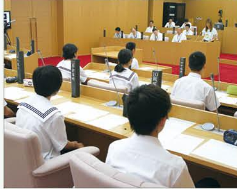
発言をする前に「はい、議長！」と挙手(写真上)