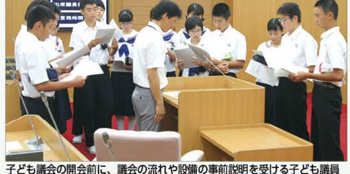
子ども議会の開会前に、議会の流れや設備の事前説明を受ける子ども議員