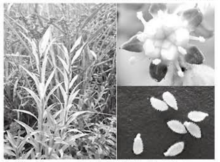
紅葉したタコノアシ(左)、花(右上)、種子

人と自然の関わりが適度なほど、豊かな自然が残されるという意味で、そのよい例がタコノアシです。タコノアシは人が踏み込んだり、草刈りをしたりすることでその生育を助けます。ユキノシタ目タコノアシ科で、日本産では1科1属1種です。同じ目にアリノトウグサ科が含まれますが、いずれもその科に含まれる種数は少なく、2属9種ほどです。科に含まれる種数が少ないことは、進化の途上、その科で大きな分化(多様性)が現れなかったか、現れても絶滅してしまったかのどちらかと考えられます。