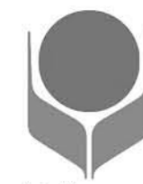
青少推のシンボルマーク

町青少年育成推進員連絡協議会(邑楽町青少推)は、県知事と町長から委嘱を受け、青少年の犯罪被害防止・非行防止・有害環境浄化など、青少年を守る活動を年間通じて行っている組織です。各行政区から1人ずつの計34人で構成されています。