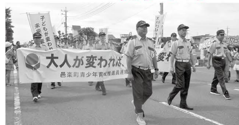
おうら祭りでパレード。活動のスローガンは「大人が変われば、子どもが変わる」