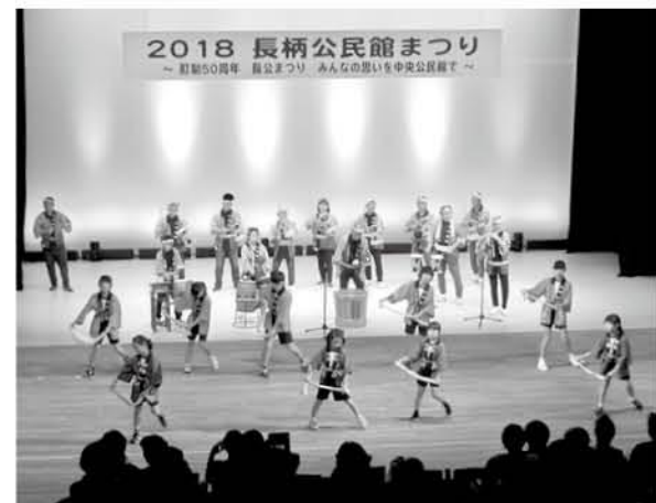
邑の森ホールで。奏者も踊り子もびのびと

長柄公民館まつり実行委員会では「令和元年新たにつなぐみんなの絆」をテーマに、長柄公民館まつりを開催します。舞台発表や作品展示、模擬店、各種体験などサークルの皆さんが日頃の活動の成果を発表します。大人気の流しそうめんは今年も開催。「タワー戦隊スワンジャー」も流しそうめんにスペシャルゲストで来場します。友達や家族と一緒にぜひご来場ください。