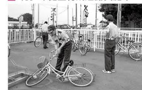
駅の自転車置き場で乱れた自転車を整列