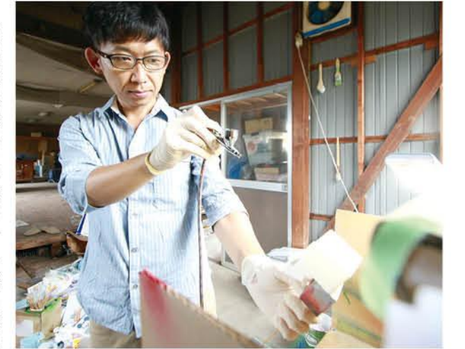
企画段階で商品サンプルを自作。彩色なども手掛ける

幼少期は視力が弱く、絵を描いたり、おもちゃで遊んだりとおとなしい子どもだった私。当時は邑楽町に個人商店の駄菓子屋や八百屋などがあり、毎日のようにそこに通いました。目当てはカプセル玩具などのおもちゃ。そのくらいおもちゃが好きで、「おもちゃ屋」が将来の夢でした。いつしかその夢のことは忘れ、デザイン学校を卒業し、就職するもすぐに退職。ぶらぶらする毎日を送る日々。けれど、大人になってもおもちゃ好きは変わりませんでした。それからおもちゃの開発会社におもちゃへの熱意を語り