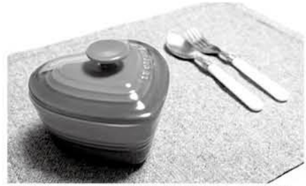
ランチョンマットは食器を乗せるための敷物