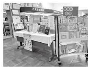
コーナーはカウンターの前に

夏休みの宿題で「自由研究や読書感想文が苦手」という小中学生はいませんか?町立図書館では、8月末まで「夏休み宿題コーナー」を設置しています。