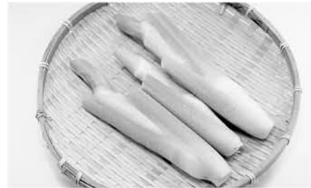
見た目や食感は、まるでタケノコのように