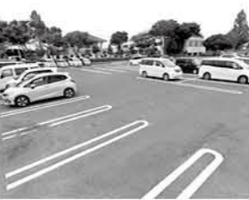
駐車場内でも安全運転を心掛けて

今回の引き直しでは、区画の見直しを行いました。ラインを2本引くことで車同士の間隔を確保。車一台あたりの駐車スペースを広くした他、町民テニスコート・スポーツ広場の駐車場では、中ほどに通行帯を確保しました。