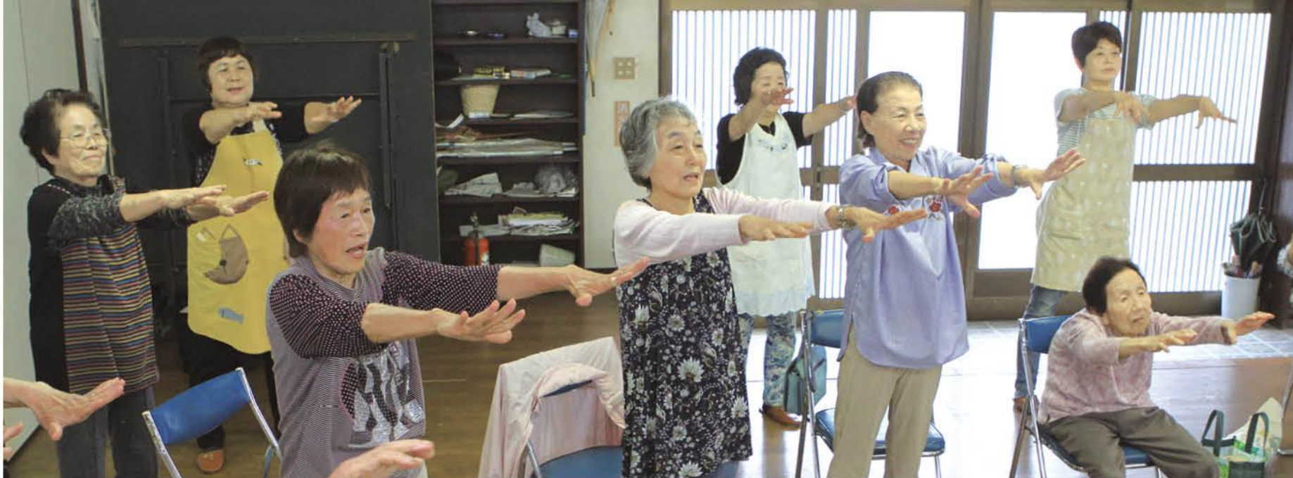
さわやか邑楽健康体操に取り組む(7月12日、12区・鶴上のふれあいサロン)

「住み慣れた土地で自分らしくいきいき暮らしたい」誰もが抱く共通の願いです。町では、元気で長生きを目指す健康・医療のまちづくりを、そして、町民が自ら取り組む健康づくりを支援しています。今回ここに、子どもからお年寄りまで誰にでも手軽に楽しんでもらえる健康体操が出来ました。ご家庭はもちろん、行政区の行事やイベントなどで使っていたら、皆さんの健康づくりに役立つことが町の願いです。