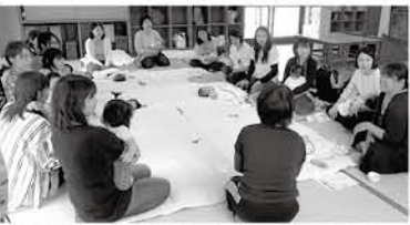
支援室では、子どももママも笑顔になれる

生後3か月前でも3か月を過ぎると赤ちゃんの首も座り、物利用できます。3も良く見え、あやすと笑顔を返してくれるなど、育児が楽しくなってくる時期ですが、それ以前は心身ともに一番大変な時期ではないでしょうか。「おっぱい足りているのかな」「なんで下で寝てくれないのかな」と不安や心配事...、そして睡眠不足と情緒も不安定になりがち。そんなときこそ、一人で悩まず「支援室体験」や『子育て相談』を利用してください。