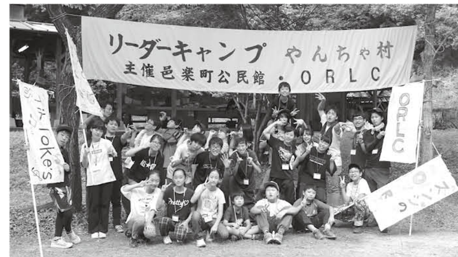
たくさん子どもたちが参加して、いろいろなイベントを楽しみました(昨年の様子)

中央公民館では今年も「ジュニアリーダーキャンプ」を開催します。普段の生活ではなかなか味わえないアウトドアライフを体験できます。飯ごう炊さん、薪を使った調理、キャンプファイアなど、大自然の中で、楽しいイベントが盛りだくさん。年齢や学校の垣根を越えて、たくさんの友達ができます。この夏休みは「ジュニアリーダーキャンプ」に参加して一生の思い出を作りませんか？