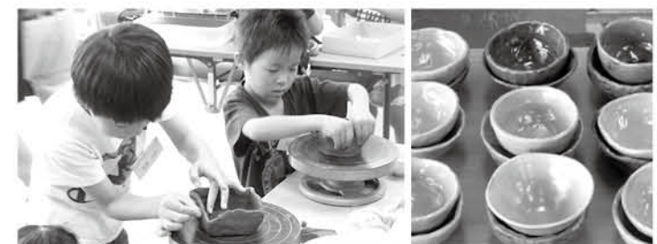
自分の思う形に作れるかな？(昨年の様子)

ヤングプラザでは、毎年夏休み期間中に「子ども陶芸教室」を開催しています。今年も角皿とご飯茶わんを作ります。講師は、ヤングプラザで活動している陶芸クラブの人たちで、初めての人にも基本から丁寧に教えてくれます。土の感触を楽しみながら、自分の作品を作ってみませんか。