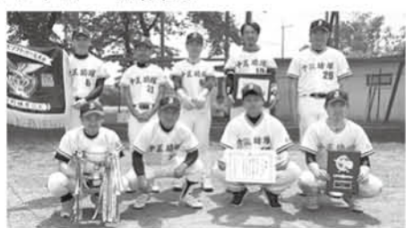
優勝を果たした十三坊塚ソフトのライン