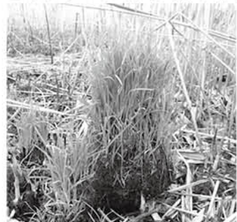
ヌマアゼスゲの谷地坊主

多々良沼は邑楽町と館林市の境にある周囲約5.6kmの沼で、邑楽町のシンボル、ハクチョウのやってくるガバ沼もその一部です。ヨシ刈りやヨシ焼きの水質浄化の効果もあって、沼尻付近は、低地湿原が発達してきています。その湿原の本体がヌマアゼスゲで、それが安定したある一定の条件で生育すると、谷地坊主という特徴ある生育形態をしているのが分かりました。ヌマアゼスゲは、根茎を横に出さない多年草の形態をしているため、株立ちになり、その上に次ぐ年の株を発達させ、それが長年積み上がっていくと、谷地坊主へと発達していくのです。北海道の釧路湿原のカブスゲや、日光戦