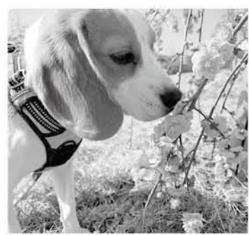
飼い犬には生涯1回の登録と、年1回の狂犬病予防注射が法律で義務付けられています