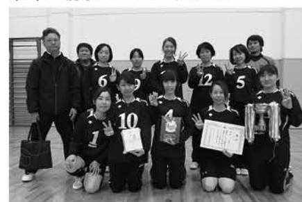
優勝した十三坊塚バレー

優勝 十三坊塚バレー 準優勝 坪谷バレーボールクラブ 第3位 前原バレーボールクラブ