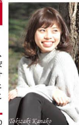
年女 24歳 1995年(平成7年)生まれ

自分の生き方を探し中 ピアノの先生になる夢は叶えたものの、理想の自分の姿には足りておらず、不安もあります。その不安を自分で何とかする術と勇気を身に付けたいです。年女となるこの一年をきっかけに、いろいろなことに挑戦していきたいと思っています。