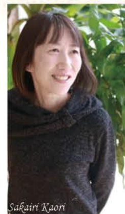
年女 48歳 1971年(昭和46年)生まれ

熱中していたことを再び 学生時代に熱中していたフルート。町民吹奏楽団の発足を機に、数十年ぶりに始めることに。また始めたいとずっと思っていたので、良いきっかけになりました。プランクが長く、当時のレベルにはまだまだだけど、レベルアップしていきます。