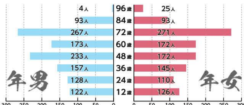
図1 邑楽町の年男・年女(亥年生まれ)の人口(平成30年12月14日現在)

データで見る、亥年生まれ 町の年男と年女をデータで見ていくと、亥年生まれの人数は2,291人で人口の約8・6%でした(図1)。 昨年同時期の成年生まれの人口は2,169人で、亥年生まれのほうが122人増となっています。これは、年齢別で昭和22年生まれの男性・女性や昭和10年生まれの男性が昨年に比べて、増加していることからでした。