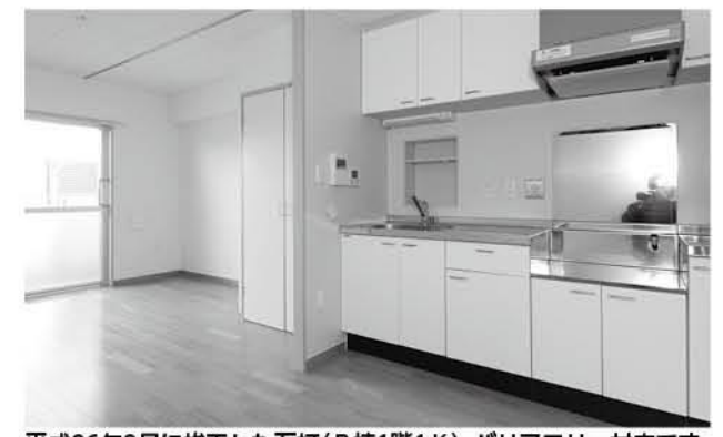
平成26年3月に竣工した石打(B棟1階1K)。バリアフリー対応です

▼その他 部屋の見学可能(要予約) ▼問合せ先 役場都市建設課 ☎47-5031