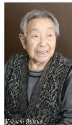
年女 96歳 1923年(大正12年)生まれ

いくつになっても楽しみを 週2回通うデイサービスでの脳トレの計算問題を解くのが楽しみ。負けず嫌だから、全部埋めるまではやめません。他にも、休日にひ孫とのランチや買い物は楽しみだね。いくつになっても、自分のできる範囲で楽しみを見つけていきたいね。