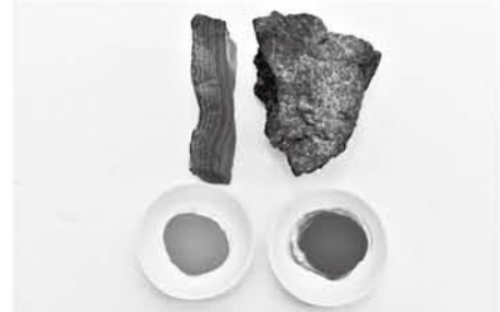
顔料(天然岩絵具)とその原石。左=緑青(緑色、孔雀石=マラカイト)、右=群青(青色、藍銅鉱=アズライト)

建造物塗装の漆塗・彩色の着色に用いる色材には、染料と顔料があります。染料は動植物由来の天然素材が使われ、水や油に溶けて紙や布の繊維を着色します。一方顔料は不溶性で、展色剤(漆や膠など)がなければ着色できません。顔料の歴史は染料より古く、人類の生い立ちとともに、その死生観に基づく葬送や祭祀、洞窟壁画や身体を装う化粧など、日常の暮らしの中で神聖な色材として使い続けられてきました。