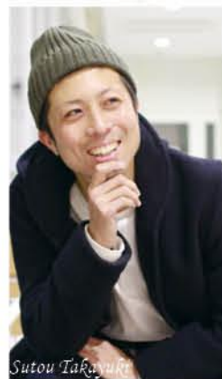
年男 36歳 1983年(昭和58年)生まれ

家族で、あの絶景をもう一度 10月に長野県上高地で家族と見た絶景。子どもと一緒にテンションMAXで、久しぶりに感動しました。よし、今年はまだ一度絶景を子どもと嫁に見せよう。そして、結婚生活も10年が過ぎ、嫁に感謝の気持ちをたくさん伝えられる一年に。『いつもありがとう』。