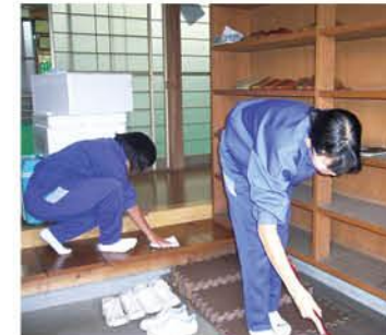
VS活動は邑楽南中の三大ボランティア活動の一つ。専門委員会を中心に、訪問先の選定や事前の打ち合わせを行うなど活動の主体は生徒。

VS活動に来る生徒さんは、しっかり挨拶ができて清掃活動を熱心に行い、地域の人からも喜ばれています。清掃を終えて「楽しく清掃ができて良かった」と話してくれました。