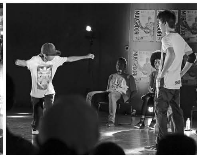
どんな曲がかかるかは予測不能! 1対1で行われる40秒の真剣勝負をぜひご覧ください(過去の様子)