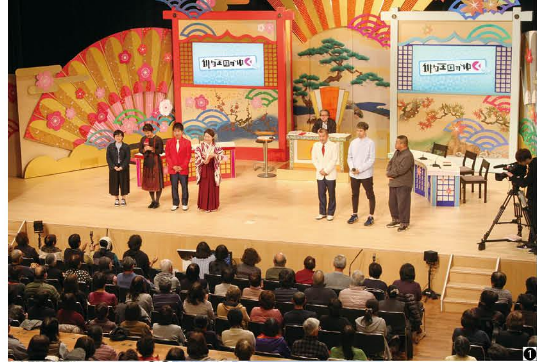
①メインステージ ②開場前に列をつくる観覧者 ③収録に関わるロケバス ④どちらの俳句が好きですか？ ⑤観覧者へプレゼントの『俳句王国がゆく』グッズ