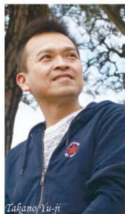
年男 60歳 1959年(昭和34年)生まれ

目指すはパーフェクトスコア 5年前に本格的に始めたボウリング。週1回程度、練習に励んでいます。レーンコンディションなどに合わせてと、考えていたら、マイボールを7個購入していました(笑)。自己ベストはスコア276。今年こそはパーフェクトスコア300を目指すぞ。