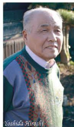
年男 84歳 1935年(昭和10年)生まれ

夫婦仲良く、長生きしたいね 健康維持のために夫婦でグラウンドゴルフと散歩を続けています。毎日の散歩は最近まで『1日10,000歩』でしたが、先生から「歩きすぎ!」と言われ、今は1日5,000歩になりました。これからも『夫婦仲良く健康』を目標に長生きしたいです。