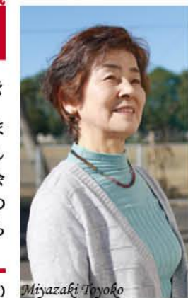
年女 72歳 1947年(昭和22年)生まれ

外国人と会話できたらすてき 観光地に行くと、多くの外国人を見かけます。そんなとき『もし外国のかたとお話しが出来たらすてきだな』と思うので、英会話に挑戦したいな。今年こそは少しずつ始めたい。そして、健康に気をつけながらまだまだ旅行も続けていきたいですね。