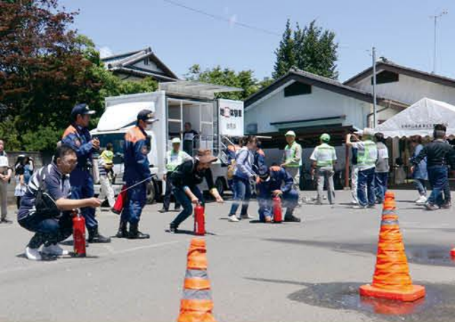
共助の備え「自主防災訓練」。こうした訓練などに取り組む行政区が少しずつ増えています。実施方法などは役場安全安心課へ。

本年は、今以上に住みよい町へと発展させるスタートの一年と位置づけて、まちづくりを行ってまいります。よろしくお願いいたします。