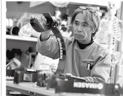
パラ選手を多数輩出している義肢装具士です ▶期日 1月26日(土)