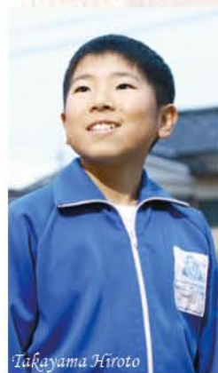
年男 12歳 2007年(平成19年)生まれ

今度に行きたい、全国の地に 7歳上の兄の影響で始めた少年野球。先輩が引退して新チームに。もちろん目指すは県大会優勝。3年前には現地に行けなかったけど、今度こそ全国大会に行きたい。冬の走り込みを頑張って、打って、走って、かき回せるような2番バッターになってやるぞ。