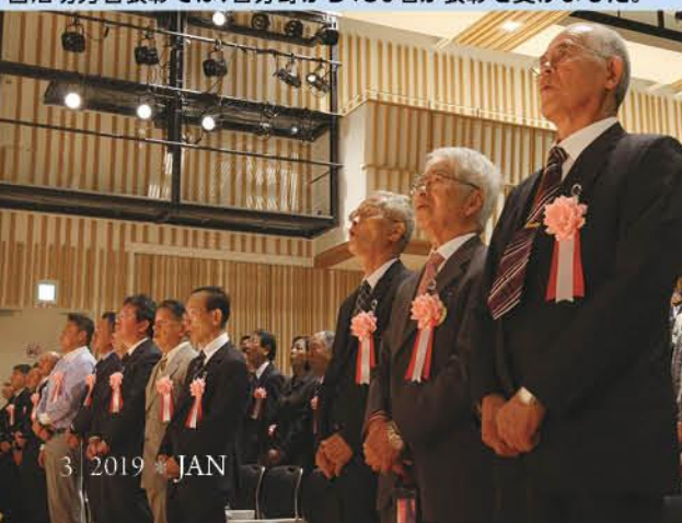
平成30年10月20日に行われた町制施行50周年記念式典。自治功労者表彰では、各分野から156名が表彰を受けました。

応募総数877作品の中から投票により「邑の森ホール」に決定した中央公民館のホール。木のぬくもりにあふれた落ち着いた内装。