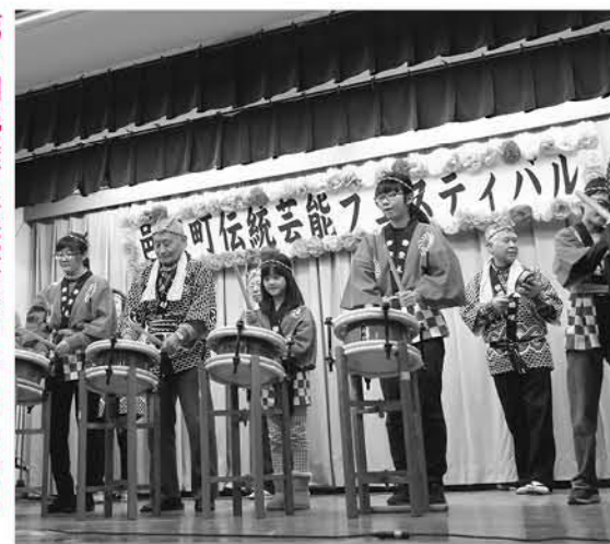
歴史ある邑楽町の伝統芸能を見に行ってみよう(昨年の様子)