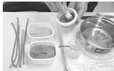
絵の具調合:棒状の膠を湯煎して水溶液にし、顔料と練り込んで絵の具を調合する

膠は動物の皮や骨などを煮詰めて(煮皮)つくられる、ゼラチンが主成分のタンパク質です。膠の歴史は古く、古代エジプトの壁画にその製造過程が描かれ、5千年以上前から接着剤としての使用が認められます。日本へは仏教文化と共に伝来したと言われています。