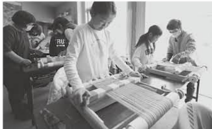
温かいマフラーを自分で織ろう