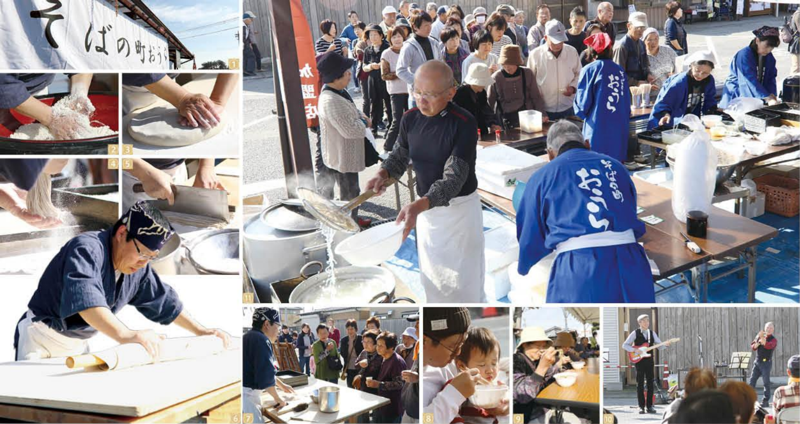
①秋晴れに恵まれた当日 ②～⑦そば打ちの実演が行われ、そば粉の割合や打ち方などを聞く来場者の皆さん ⑧・⑨子どもから大人までそばを堪能 ⑩ギターと歌が会場を盛り上げました ⑪行列ができるほどの大盛況

町では、町内にあるそば店を紹介した『おうら蕎麦手帳』を発行しています。町のそば店を知りたい人は、ぜひご覧ください。蕎麦手帳は役場農業振興課、町商工会、町立図書館で配布している他、町ホームページで見ることができます。