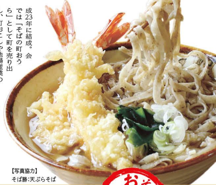
天ぷらそば

「そばの町おうら会」はイベントや社会福祉施設でのそば振る舞いの活動を通して、PRを行っています。この会は町のそば店が、平