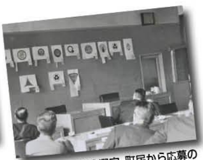
昭和47年、町章の選定。町民から応募のあった55作品の中から選ばれました