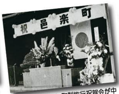
昭和43年4月1日、町制施行祝賀会が町野小学校体育館で行われました