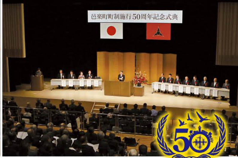
中央公民館で町制施行50周年を祝った記念式典 町や近隣自治体の関係者約300人が集まった