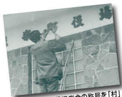
昭和43年4月、役場庁舎の称号を「村」から「町」に取り付け変える役場職員