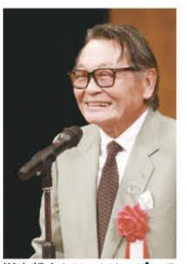
洋次郎さんは、オリンピック大会のレスリング競技で2連覇(1964年東京、1968年メキシコ)。邑楽町名誉町民。

講演で洋次郎さんは、レスリングに心を奪われた中学生時代の話から悲願であったメダル獲得に至るまでの軌跡、そして2連覇が掛かったメキシコ大会での心境を話し、「上達したときに現れる壁を、工夫と努力で打ち破る経験が面白く、ますますレスリングに情熱をもった」と話しました。