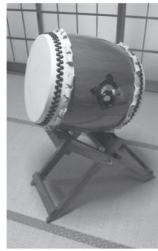
太鼓は町民体育祭などで活用されます

これは、宝くじの収益金などを財源に、(公財)県市町村振興協会が実施している「魅力あるコミュニティ助成事業」を活用したものです。 ▶ 問合せ 役場企画課 ☎47-50009