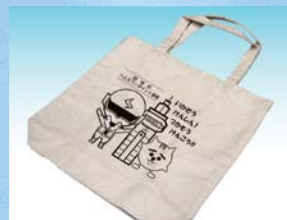
オリジナルエコバッグ