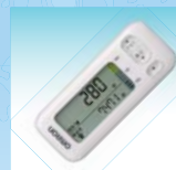
③オムロン活動量計