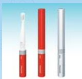
②ドルツ電動歯ブラシ