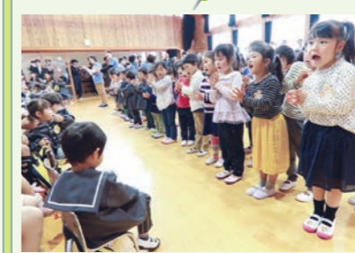
お兄さん、お姉さんがお歌で歓迎