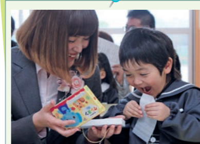
真新しいクレヨンに……!!