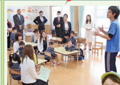
先生がいるから安心