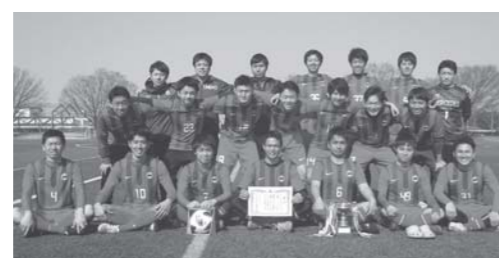
優勝したブラックおおたんの皆さん