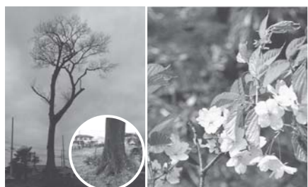
国道122号大根村交差点北西のオオヤマザクラ

山地に自生する特徴のオオヤマザクラが町内に存在すること自体不思議なことです。松本古墳群第21号墳の墳頂に、樹高18.9m、目通り2.6m、長径1.0m、根回り5.7m、長径2.1m、樹幹東西11.8m、南北9.6mの一本桜として偉容を誇っています。今から20年も前に天然記念物指定候補の筆頭として君臨していた名木であります。惜しくも指定にこぎつけることができませんでした。国内には国県市町村指定のオオヤマザクラは10本ほど数えませんが、樹高に限り邑楽町が国内最大級で、どの指定樹であっても超えるものはありません。ソメイヨシノが咲き終わる頃、淡紅色の花を咲かせ、山桜より