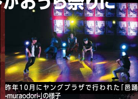
昨年10月にヤングプラザで行われた「邑踊-muraodori-」の様子

昨年、ヤングプラザで行われた邑楽町初のダンスイベント「邑踊-muraodori-」が今年も開催決定。今年は、2回開催。第1回目は、おうら祭りと同時開催です。