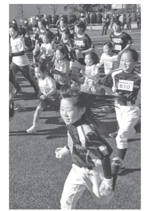
青空の下、みんな元気に走り切りました