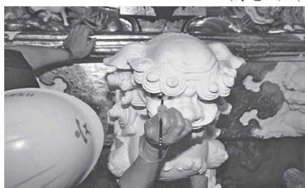
陽明門下層木鼻の胡粉塗唐獅子彫刻 開眼・魂入れ

おとしし12月の本紙掲載以来、丸1年がたち、日光東照宮陽明門の修理事業も、いよいよこの3月に竣工式典の慶事を迎えます。