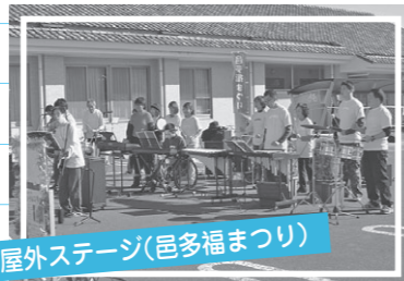
屋外ステージ(邑多福まつり)