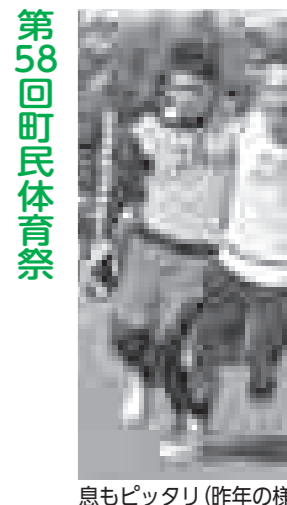
息もピッタリ(昨年の様子)

第58回町民体育祭 ▼期日 10月2日(日) (荒天の場合は中止) ▼時間 午前8時開会 ▼会場 スポーツ・レクリエーション広場 「競技参加者の募集」 次の競技では、一般参加者を募集します。職場の仲間やサークルの友達と一緒に参加しませんか。奮ってご参加ください。 ▼募集種目 団体・事業所対抗リレー、スポーツクラブ対抗百足競争、2kmロードレース ▼申込・問合せ先 町民体育館 ※10月2日(日)は町民体育祭のため、社会教育施設は休館となります。