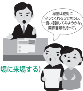
秘密は絶対に守ってくれるって言うし、一度、相談してみようかな。関係書類を持って。

日時▶10月29日(土)午前10時~午後3時 会場▶城沼公民館(館林市松原) 問合せ▶群馬県行政書士会館林支部☎20-3439(田沼)・80-2100(川島)