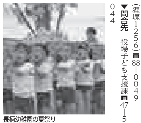
長柄幼稚園の夏祭り