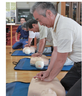
②自分の身は自分で守ることが非常時に一番重要です

地区の防災訓練に参加してきました。昨年は行けなかったため、住民参加型の防災訓練を初めて体験しました。地区での防災訓練実施は参加しやすいのでありがたいです。 災害時、自分自身の身は自分で守ることが大切なので、今日学んだことを非常時に生かせればと思います。