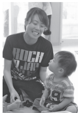
町の未来を創る仕事です

町では、臨時職員を募集します。 ▼募集職種 学校給食センター調理員、幼稚園教諭保育士 ※幼稚園教諭・保育士は資格、免許が必要。 ▼人数 若干名 ▼雇用期間 9月1日(日)から ▼選考方法 書類審査、面接など ▼応募方法 履歴書(市販のもの)提出 ▼受付期限 8月24日(日) ▼受付時間 午前8時30分～午後5時