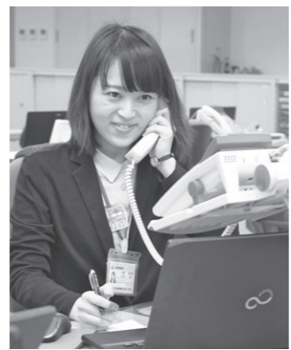
はい！邑楽町役場です

町では、平成29年度に採用する町職員を募集します。 ▼募集職種 一般事務 ▼人数 若干名 ▼受験資格 平成元年4月2日以降に生まれた人で、学校教育法による大学（短期大学を除く）を卒業または平成29年3月31日までに卒業見込みの人 ▼試験日・会場 第一次試験 7月24日⑧・町役場 第二次試験 8月下旬に予定・町役場 ▼受付期間 6月13日⑧～22日⑧