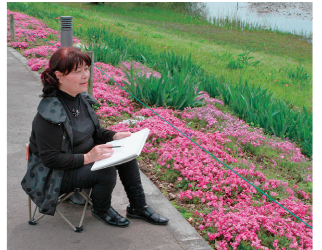
天気のいい日にはスケッチも。忙しいけれど楽しい毎日

平日はサークルの練習、土 日は大会や発表会などがあ るため、とても忙しい毎日だ ですが、今まで大きな病気にか かったことがありません。こ れはサークル活動のおかげだ と思います。友達もたくさん できましたし、心身ともに健 康でいられます。