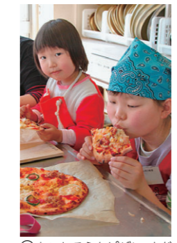
④おいしそうなピザに、よだれが……。今日は出前かな