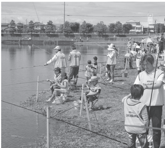
みんなで外来魚問題を考えよう(昨年の様子)