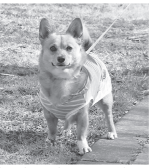
飼い犬には生涯1回の登録と、年1回の狂犬病予防注射が法律で義務づけられています

町では、左表の日程で狂犬病予防注射を行います。最寄りの実施場所、または都合の良い場所・日時を選び、直接会場へお越しください。 ▼接種費用 登録済みの犬 3,400円 未登録の犬 6,400円 ▼問合せ 役場安全安心課 47-5018