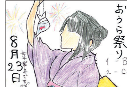
PN.まつりっ子 ②記念すべき第1回おうら祭りは平成3年7月14日、中野 東小学校周辺で行われ、約1万人が訪れたそうです。

25周年おめでとうございます。四 半世紀というと、一つの区切りのよ うな気がして、長い歴史を感じます。 毎年とても楽しみにしているおうら 祭り。今年は8月23日(日)なんです 祭りが美しく上がるように、雨が降 らないことを祈っています。