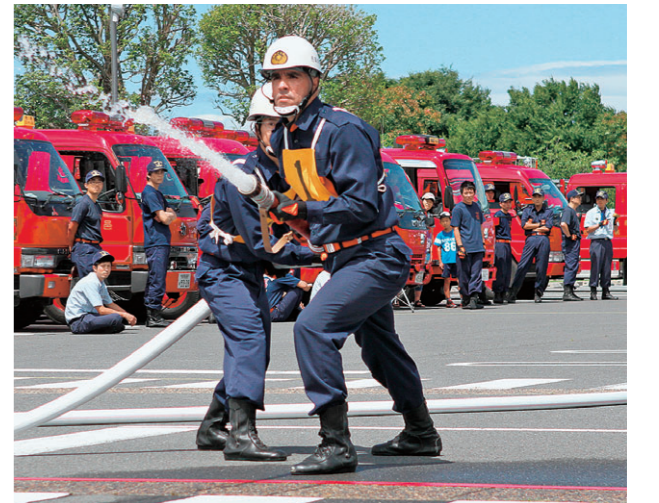
6月に行われた町ポンプ操法大会では1番員を務めた