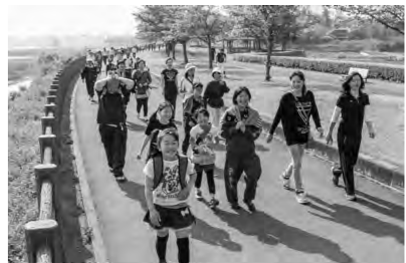
春の気配を感じながら、みんなで楽しく歩いてみませんか(昨年度の様子)