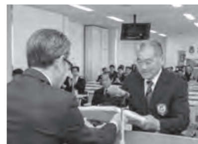
町青少年推会長から表彰状が贈られました

2月7日、町役場で青少年健全育成推進大会が開催されました。これは、地域ぐるみの青少年健全育成を進めるため、町青少年育成推進員連絡協議会が毎年開催しているものです。大会では、青少年健全育成に功績のあった行政区など2団体・5個人が表彰されたほか、人権作文優秀作品の朗読が行われました。また、表彰式終了後、「大声コンテスト」を昨年に引き続き開催。小学生25人が「将来の夢」をテーマに元気いっぱい大声を出し会場が盛り上がりました。