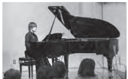
美しいメロディーに癒されてみませんか