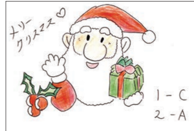
PN.クリス @サンタさん、今年こそ来てくれるかな……