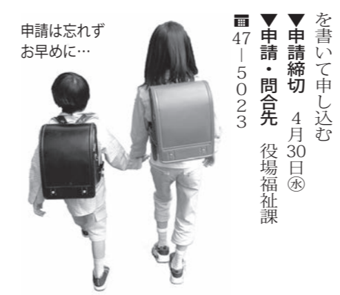
申請は忘れずお早めに… を書いて申し込む ▼申請締切 4月30日④ ▼申請・問合せ 役場福祉課 47-5023

▼対象 離婚・死別などで母子・父子家庭になった児童、父母のいない児童 ▼支給額 小学校入学(平成19年4月2日～平成20年4月1日生まれ)1万円 中学校入学(平成13年4月2日～平成14年4月1日生まれ)1万5,000円 高等学校進学(平成10年4月2日～平成11年4月1日生まれ)2万円 ※高校に進学しない場合は、中学校を卒業したときに該当になります。 ▼申請方法 所定の申請書に必要事項