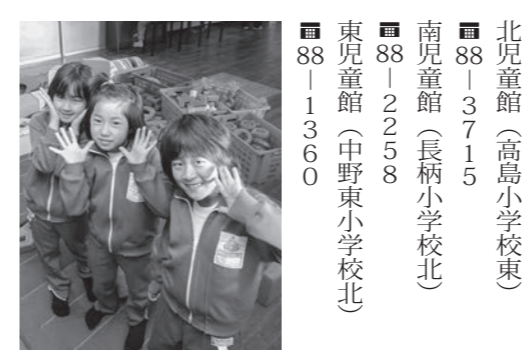
北児童館(高島小学校東) 88-3715 南児童館(長柄小学校北) 88-2258 東児童館(中野小学校北) 88-1360 ※現在児童館を利用している場合でも、改めて年度ごとの申込が必要です。

▼利用時間 一般児童 放課後～午後5時(放課後自由に児童館を利用できます) 留守宅児童 放課後～午後6時30分 ※保護者が働いており、下校しても自宅に保護者のいない児童が対象。申込に就労証明書などが必要です。家族の人が迎えに来ることも条件です。 ▼登録方法 児童館にある所定の申込書に必要事項を書いて申し込む ▼申込・問合せ 中央児童館(中野小学校北) 88-6135