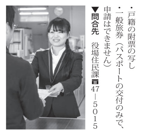
・戸籍の附票の写し ・一般旅券(パスポート)の交付のみで、申請はできません) ▼問合せ 役場住民課 47-5015

▼窓口延長日 毎週火曜日 ※祝日・年末年始は除きます。 ※役場庁舎の正面玄関(西側)からお入りください。 ▼時間 午後5時15分～7時15分 ▼交付できる書類 ・住民票の写し ・住民票の記載事項証明書 ・印鑑登録証明書 ・印鑑登録証 ・戸籍の証明書