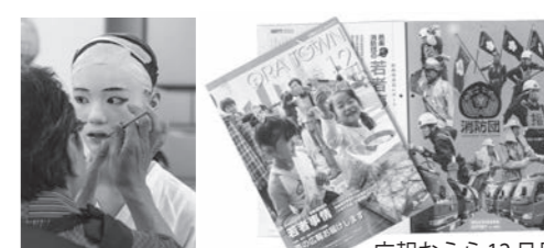
写真の部第一席「紅差す少女」(11月号より) 広報おうら12月号 ※第一席に輝いた広報誌と写真は、日本広報協会主催の全国広報コンクールに出品されます。

1月17日、県と県広報協会主催の市町村広報コンクールの審査会で、「広報おうら」12月号が広報誌町村の部で最優秀賞に当たる第一席に選ばれました。写真の部でも第一席に選ばれ二冠を達成。広報おうらは、昨年に続いての第一席。4年連続9回目です。 講評では「企画内容も地元に着着した読ませる内容だった」、「見てほしい読んでほしいという作り手の思いが伝わってくる」など、審査員から好評価を受けました。