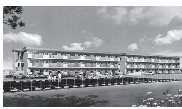
↑石打町営住宅(完成予想図) 住所・石打1171-1 構造・鉄筋コンクリート3階建て

町では3月末に完成予定の石打町営住宅団地B棟(第2期)の入居者を追加募集します。 ▼募集期間(応募者多数の場合抽選) 3月3日④～31日④ ▼入居資格(収入制限あり) ①町内に在住か在勤し、親族と同居する予定の現在住宅に困窮している人 ②単身の高齢者・障害のある人で現在住宅に困窮している人 ③①か②に該当し、その他の入居資格をすべて満たすこと(単身の場合は①と②両方に該当) ※その他の入居資格については、役場