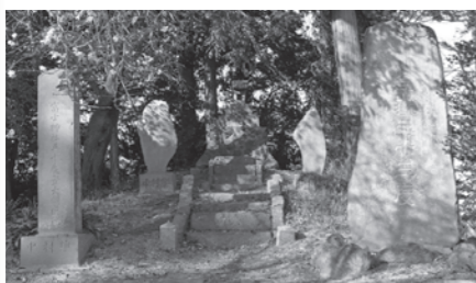
西祀開神社境内にある富士塚(藤川地内)

秋妻では、玉取神社境内に富士塚を築き石祠の浅間神社が祀られ、刻銘には「嘉永二年(1849)八月別当玉命山宝泉寺」とあるので当時は寺が神社を管理していたこととなります。現在は付随すべき烏帽子岩などは見当たりません。