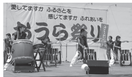
上州ろう太鼓「心響」の皆さん