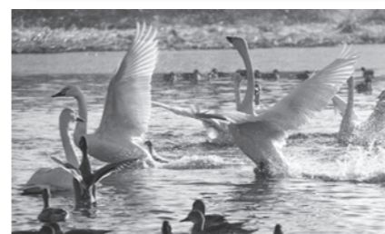
白鳥を間近で観察してみませんか