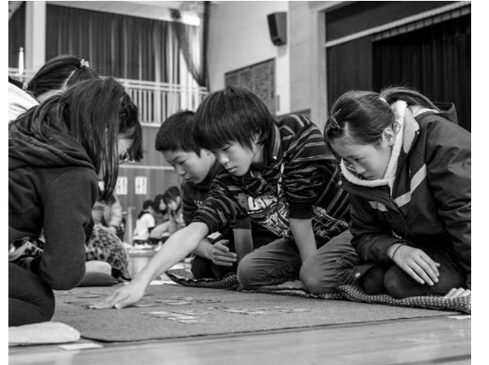
大会では、毎年熱戦が繰り広げられます

第52回邑楽町上毛かるた大会 ▼期日 平成26年1月5日(日) ▼時間 午前8時開会 ▼会場 中野小学校体育館 ▼競技種目 小学生低学年団体・個人、小学生高学年団体・個人、中学生団体・個人 ※各種目の優勝・準優勝者は、邑楽郡上毛かるた大会(大泉町開催)への出場権を獲得します。 ※インフルエンザの発生状況などにより、大会を中止することがあります。 ▼申込先 各行政区子ども会育成会役員 ▼問合せ先 邑楽町公民館