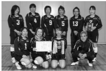
Aクラス優勝のFRESHの皆さん

Aクラス 優勝 FRESH 準優勝 ウイング 第3位 天王元宿バレーボールクラブ、十三坊塚バレー