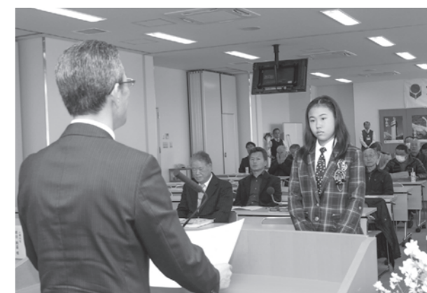
町青少年推会長から表彰状が贈られます

■教室・講座などの申し込み方法 ▶申込開始当日 申し込み開始時間に申込先の窓口へ、本人または家族の人が直接申し込みください。 ▶申込開始日翌日以降 定員に満たない場合、電話での申し込みを受け付けています。