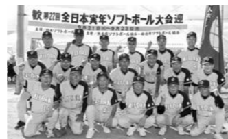
全国ベスト16のオール邑楽の皆さん

9月21日～23日、熊本県菊池市のグラウンドを会場に全日本実年ソフトボール大会が行われました。全国の予選会を勝ち抜いた48チームが熱戦を展開。群馬県代表のオール邑楽は、攻守にわたり熱戦熱闘を繰り広げ全国ベスト16に輝きました。