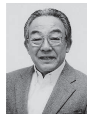
俳優 高橋元太郎氏

テレビ時代劇「水戸黄門」の「うっかり八兵衛」役でお馴染みの人気俳優。20歳で歌手デビュー。現在は俳優を中心に映画・テレビ・舞台に幅広く活躍中。「人生は出会いで始まり、出会いで終わる」が信条。