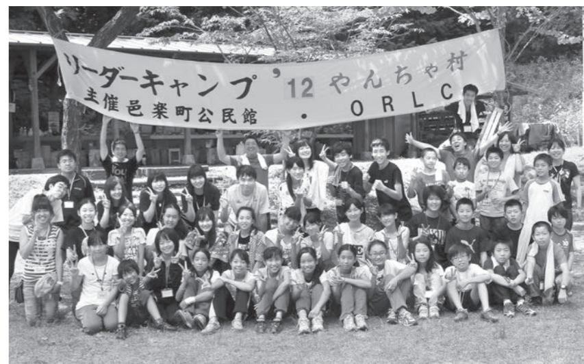
ジュニアリーダーキャンプに参加して夏休みを楽しもう(昨年のキャンプ)

最近、いじめや差別が原因で、自殺をしてしまったというニュースが取り上げられていますが、自殺をした人はどんなに心が傷ついたのか、どんなに悲しかったのかと、心の傷はとても深かったと思います。いじめをする人はなぜ、そこまで追いつめ、いじめを続けるのだらうと思います。いじめをすれば、やられた人の気持ちはたとえその後、いじめがなくなったとしても、心の傷は残ったままに