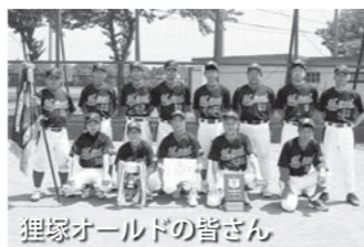
狸塚オールドの皆さん

優勝 狸塚オールド 準優勝 十三坊塚ソフト 第3位 田島運輸ダイヤモンドスターズ 第3位 坪谷ソフトボールクラブ