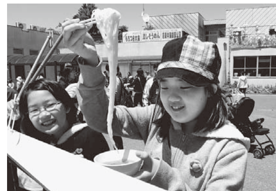
毎年恒例の流しそうめん。みんなで食べる流しそうめんは最高です

邑楽町公民館まつり実行委員会では、2013 邑楽町公民館まつりを開催します。邑楽町公民館を拠点に活動している団体やサークルなどの皆さんが、日ごろの活動の成果を披露します。今年のテーマは「友の輪が世代へ広がる公民館」。作品展示・舞台発表・模擬店・体験コーナーと、内容は盛りだくさん。あなたも、邑楽町公民館まつりで一緒に楽しみませんか。