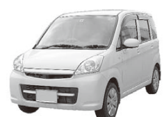
毎年申請が必要です。お忘れなく