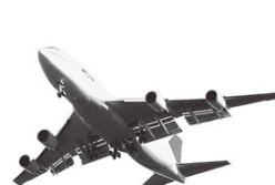
ふるさとの今を伝える 広報おうらをお届けします

会員になると、毎月「広報おうら」を世界中のどこへでもお送りします。 ▼会費(1年間) 1,000円 日本国内 2,000円 アジア地域 2,400円 オセアニア・北米・ヨーロッパなど 2,700円 南米・アフリカなど 2,700円 ▼申込方法 役場企画課、または町ホームページにある申込用紙に必要事項を書き、会費を添えて申し込む