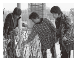
毎年人気の苗木の無料配布。当日は、「緑の羽根募金活動」も行います。皆さんのご協力をお願いします

町では、緑化運動推進の一環として、 苗木の無料配布を行います。 ▼期日 4月20日(※) ▼時間 午前10時~ ▼会場 シンボルタワー駐車場 ▼内容 緑の羽根募金・苗木無料配布 ※苗木は数に限りがあります。 ▼問合先 役場産業振興課 ☎ 47-50227