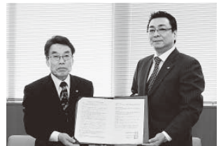
11月26日役場で、町と(株)サイネックスの間で「生活ガイドブック」発行調印式が行われました。生活ガイドブックは5月に発行予定です。

町では、邑楽町「生活ガイドブック」を(株)サイネックス(本社・大阪市)との官民協働事業により発行予定です。発行にあたり広告主を募集します。(株)サイネックスの広告担当者が営業を行いますので、ご協力をお願いします。※広告についての詳細は、(株)サイネックスにお問い合わせください。 ▼問合せ 役場企画課 ☎47-50008 (株)サイネックス小山支店 ☎0285-121-3434