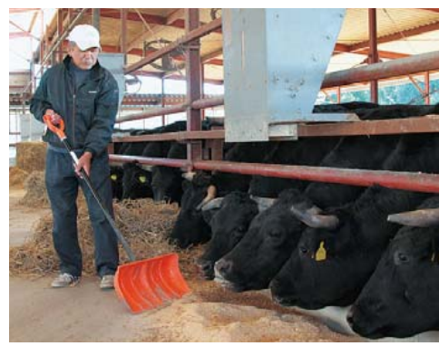
毎日かかさず、よい牛に育つように愛情を込めてえさを与えます

私が肉用牛の肥育(素牛を 買い、育てること)を始めた のは23歳のころ。それまで営 んできた米麦作以外に新しい ことへ挑戦したかったこと、 そして何より動物が好きだっ たことがきっかけでした。 当時はマニュアルもなく、 実際に育てながら勉強した くさんの困難な壁がありました が、妻をはじめ多くの人が ちに支えられながら乗り越え てくることができました。 肉牛農家の作業は、家族や 地域の人の協力なしには できません。飼料の稲わら一