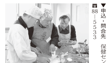
料理をしたことのない男性も、料理の得意な男性も、ぜひご参加ください