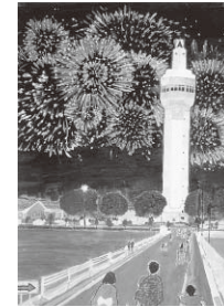
高橋幸大さんの作品