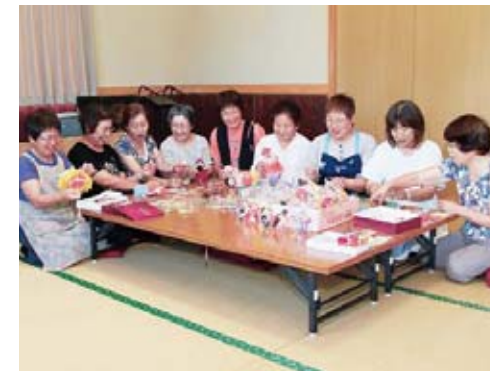
みんなで一つひとつ思いを込めて作りあげます