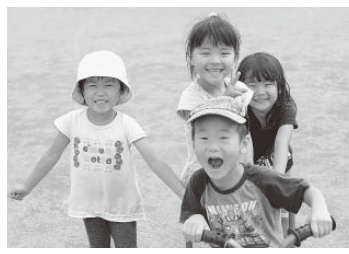
皆さんの子育てを支援します

▼対象 町内に住んでいる(住民票のある)、次の理由で保育できない児童 ①保護者が常に働いている ②保護者が病気や心身障害の状態にある ③保護者が、長期にわたる病気や心身障害のある家族の看病をしている ④母親が妊娠中、または出産後間もない(出産前後2、3か月) ⑤保護者が、震災・風水害・火災などの災害の復旧にあたっている ※集団生活を体験させたい、幼児教育の場として利用したいというだけでは、入園の対象にはなりません。 新規の入園申し込み ▼期日 10月19日(金) ▼時間 午前9時30分〜午後4時30分