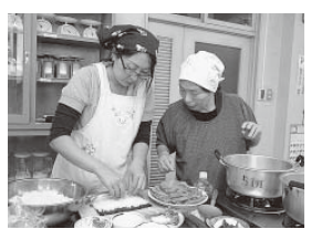
冷や汁や鶏ハムサラダ、ケーキ・サレ(塩風味パウンドケーキ)などの献立を予定

生活研究グループ連絡協議会では、伝承・伝統料理講習会を開催します。 ▼期日 10月9日(金) ▼時間 午前9時30分〜午後1時30分 ▼会場 長柄公民館 ▼内容 伝統料理などの調理実習 ▼対象 高校生までの子どもを持つ町内在住の父母 ▼定員 15人(先着順) ▼参加費 300円(材料費) ▼申込方法 直接窓口で申し込む ※土・日曜日、祝日を除く、午前8時30分〜午後5時15分までです。