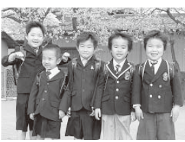
みんな元気に入学

町教育委員会では、平成25年4月に小学校に入学する児童を対象に健康診断を行います。 ▼対象 平成18年4月2日〜平成19年4月1日生まれで、町内に住んでいる(住民票のある)児童 ▼内容 健康診断と知能検査 ▼受付時間 午後1時15分〜30分 ▼中野小学校 ▼期日 10月26日(金) ▼対象行政区 3、9区 ▼高島小学校 ▼期日 10月17日(金) ▼対象行政区 10、11、16、21区 ▼長柄小学校 ▼期日 11月1日(金)