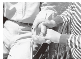
町の介護保険事業に参加してみませんか

町では、邑楽町介護保険運営協議会の委員を募集します。 ▼対象 介護保険制度に関心のある、町内在住の20歳以上の人 ▼募集人数 3人 ▼委員の仕事 会議への参加など ▼任期 3年 ▼応募方法 作文(テーマ「これからの高齢者福祉について」原稿用紙1枚程度)を添付して、直接または郵送で