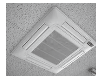
猛暑時にも活躍し、冬場も含め1年を通じてコミュニティ活動の強い味方となります