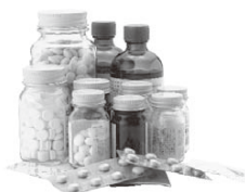
依存症は意志の弱さや性格の問題ではなく、薬物やアルコールによる脳の障害です

県こころの健康センターでは、精神科医師による薬物・アルコールなどの依存症の相談を行っています。家族の人だけの相談もお受けしております。 ▼相談日 毎月第2火曜日 ▼時間 午後1時30分～4時 ▼会場 県こころの健康センター(前橋市野中町) ※相談は予約制です。相談専用電話 ☎027-263-1156 で内容を、お伺いしたうえで予約を受けます。 ▼問合先 県こころの健康センター ☎027-263-1166