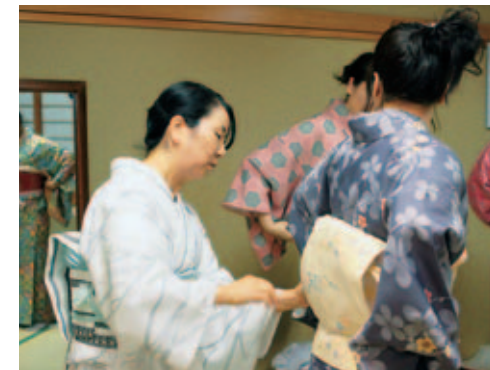
帯の締め方も、簡単にできるよう一工夫(ヤングブラザの着付け講座)