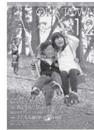
平成 23年 12月号

日本広報協会の主催する平成24年全国広報コンクールの結果が5月8日に発表され、群馬県代表として推薦されていた広報おうらが、広報紙(町村部)で入選しました。平成11年の入選以来、13年振り5度目の全国入選。これもご協力いただいた皆さんのおかげです。ありがとうございました。